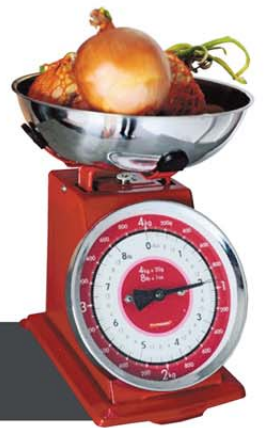
Keukenstilven: weegschaal met ui.